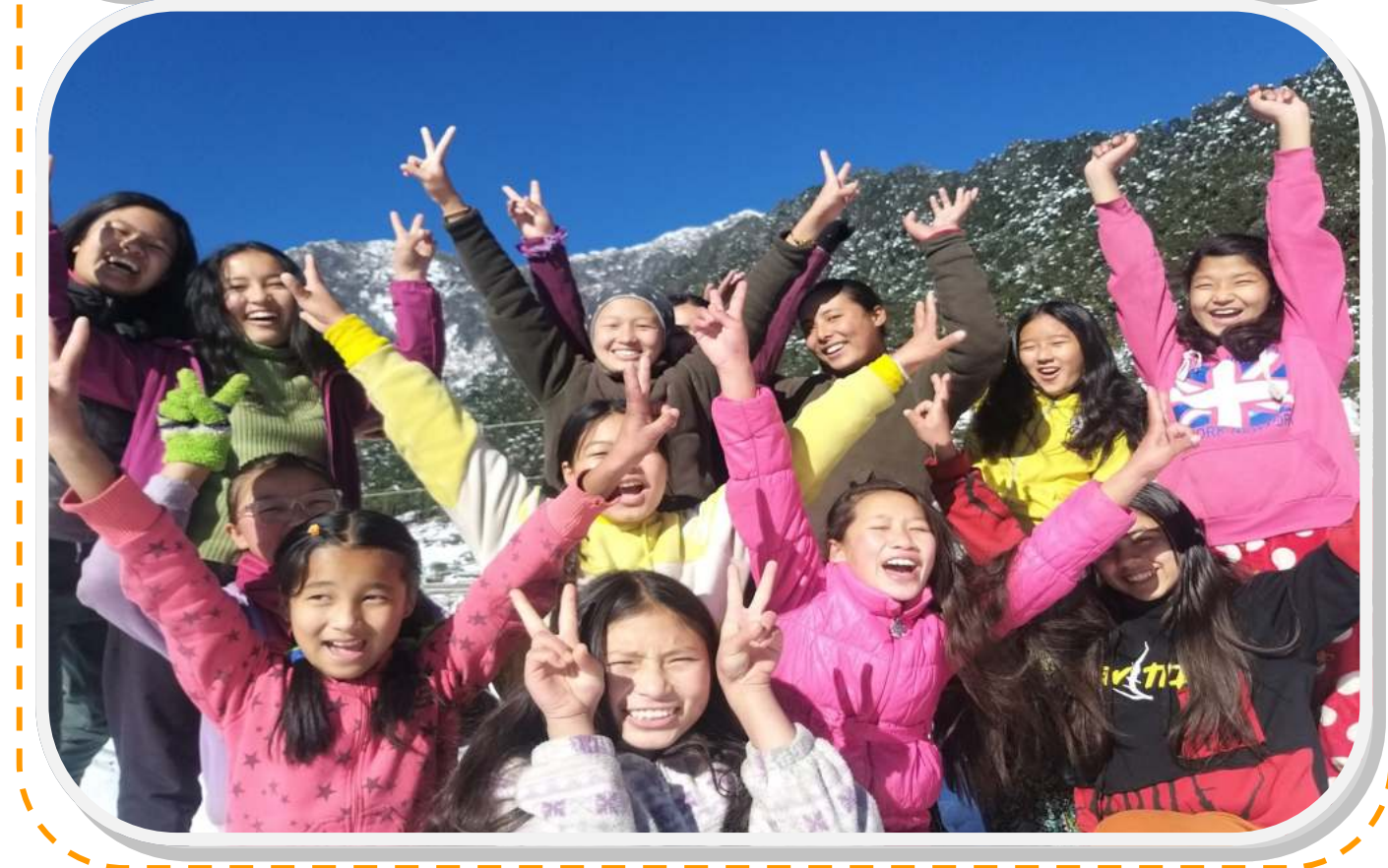
Snowfalls at Melamchi Ghyang