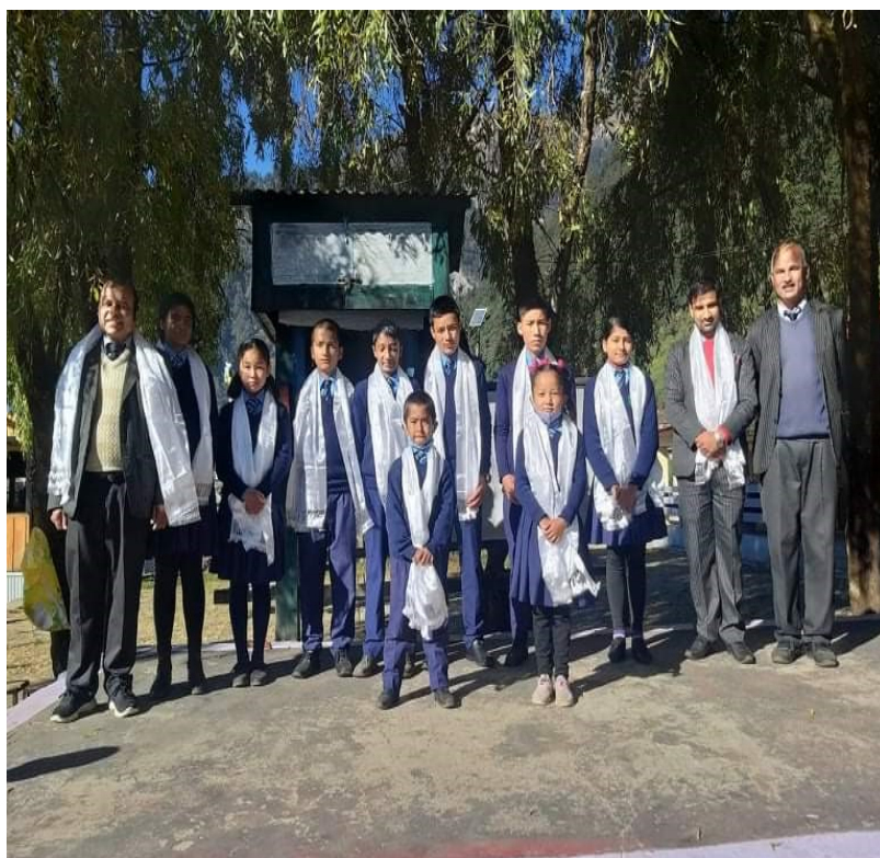
Farewell of SEE students and photos of Child Club